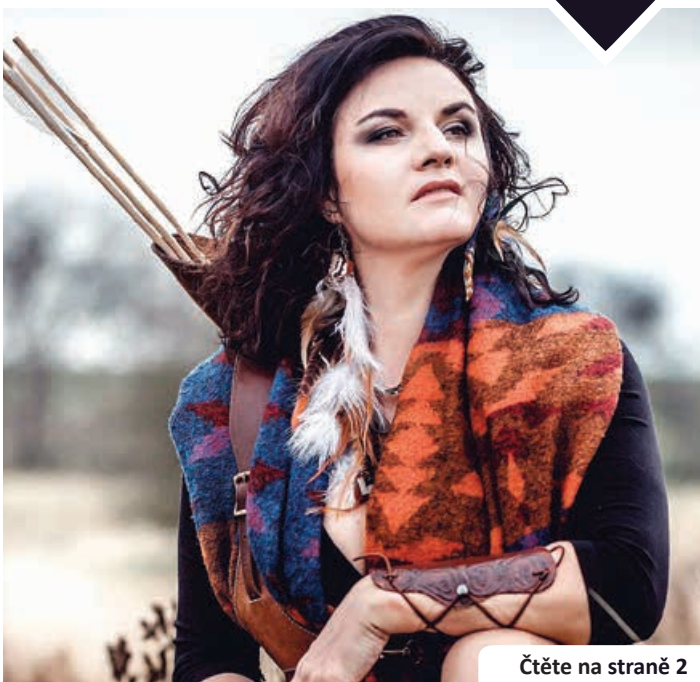
Čtěte na straně 2