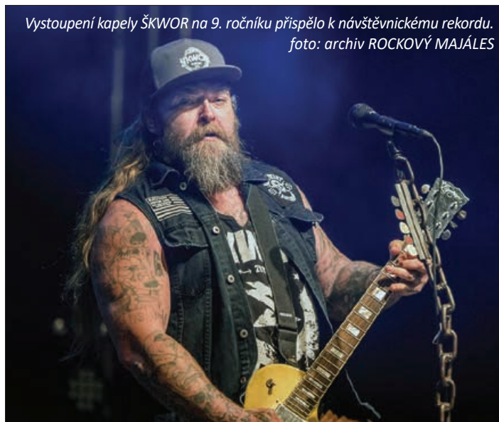
Vystoupení kapely ŠKWOR na 9. ročníku přispělo k návštěvnickému rekordu.

Během posledních let přibývá počet prodaných vstupenek na ROCKOVÝ MAJÁLES „ZUBŘÍ ZEMĚ“ v období před Vánoci, neboť vstupenky se stávají v řadě případů originálním vánočním dárkem. Proto během celého listopadu mohou zájemci zakoupit v první předprodejové limitované edici zcela nejlevnější vstupenky v síti Ticketportal.cz, a to jak v kamenných prodejnách, tak i z pohodlí domova přes internet. První NOVINKOU desátého ročníku jsou rodinné a skupinové VIP vstupenky RODINKA, PARTIČKA, PARTA, PARTA XL a PARTA XXXL s vlastním party stánkem, posezením a vlastním chlazeným výčepem piva nebo nealka. Druhou NOVINKOU je možnost bezplatné registrace do MAJÁLESOVÉHO VĚRNOSTNÍHO KLUBU,