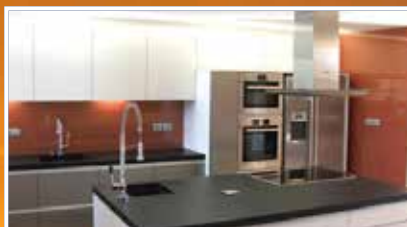
barevné sklo místo obkladů