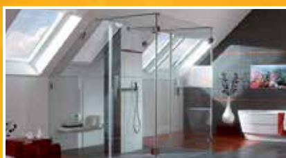
sprchové kouty, zastěny