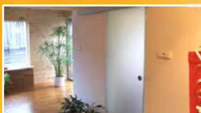
celoskleněné posuvné dveře