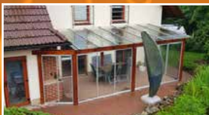
lodžie, balkony, pergoly