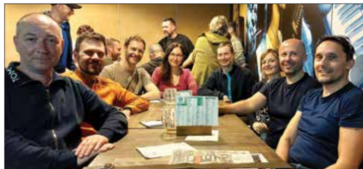
Vítězný tým dubnového kola QUIZu: NUDLÉ Z NOSU