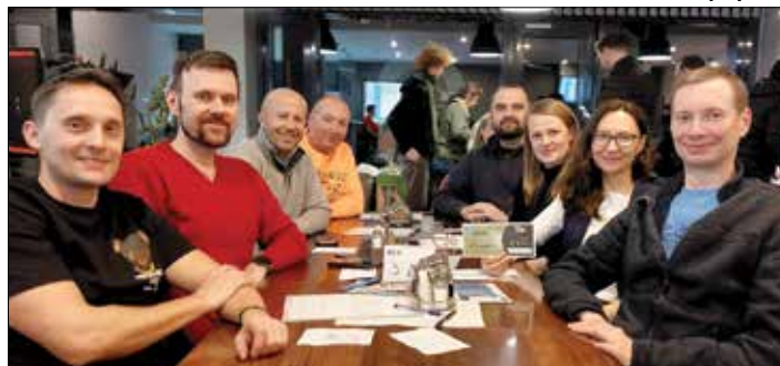
Vítězný tým březnového kola Chytrého kvízu: NUDLÉ Z NOSU