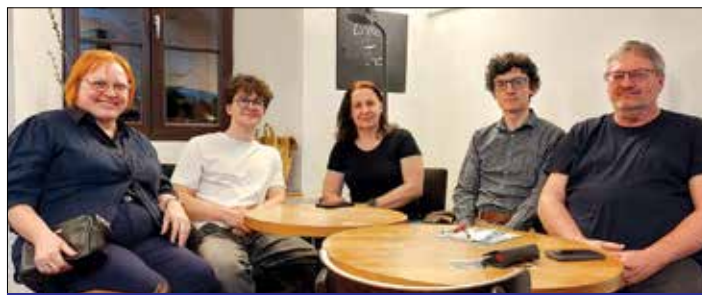
Vítězný tým březnového úterního kola Chytrého kvízu: #WEJMLUVA