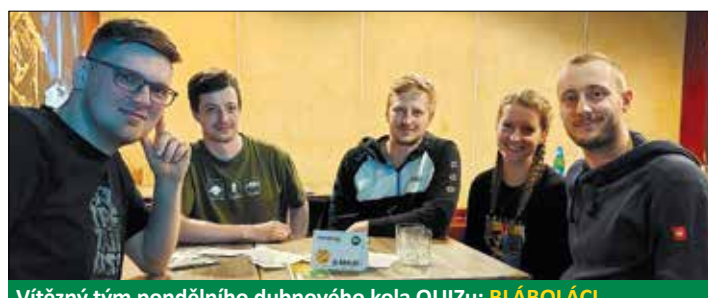
Vítězný tým pondělního dubnového kola QUIZu: BLÁBOLÁCI