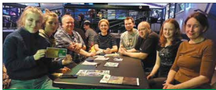
Vítězný tým nedělního dubnového kola QUIZu: KALKULAČKY