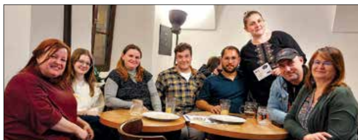
Vítězný tým březnového středečního kola Chytrého kvízu: PMS